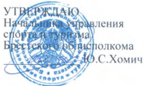
ГРАФИК ПРИЕМА ГРАЖДАН И ЮРИДИЧЕСКИХ ЛИЦ В УПРАВЛЕНИИ СПОРТА И ТУРИЗМА БРЕСТСКОГО ОБЛИСПОЛКОМА