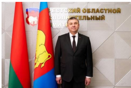
Шулейко Юрий Витольдович Председатель Брестского облисполкома