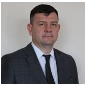
Барауля Александр Иванович Заместитель Министра спорта

вторая среда оставшихся месяцев с 8:00 до 13:00