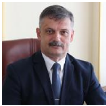
Ковальчук Сергей Михайлович Министр спорта

(220030, г. Минск, ул. Кирова, д. 8, кор. 2)